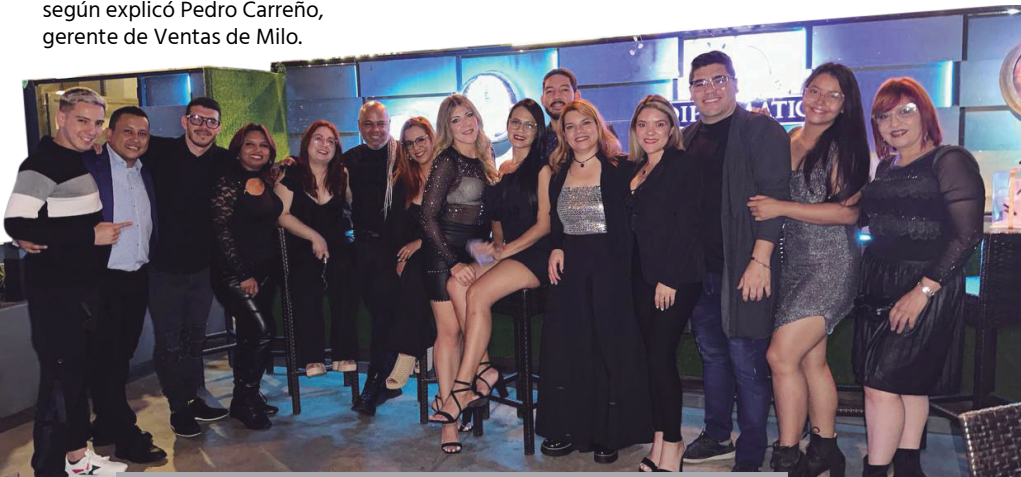
Equipo de mercadeo y técnicos capilares de Milo, responsables del magno evento